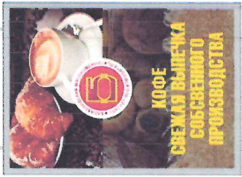
Макет в деталях формат А1