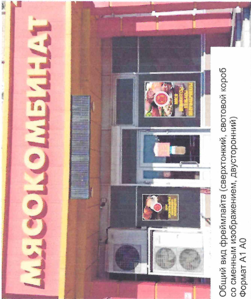
Общий вид фреймлайта (сверхтонкий, световой короб со сменным изображением, двусторонний) Формат А1 А0